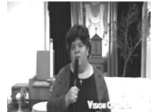
Estelita Villegas en la música